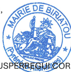
Odile SUSPERREGUI CORNU