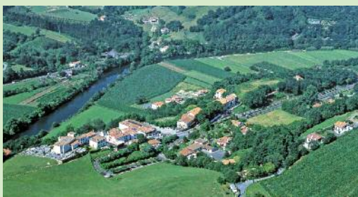
Biriato, airetik hartua.

E skaintzen dituen ezaugarriak baizik ez ikusteko balio duen Biriatuko herritik abiatuz, segi ezazu aitzina euskal mendixketaruntz. Itsas bazterreko bista xoragarrietaz gain, pottokak, ardiak eta saiak ikusiko dituzu.